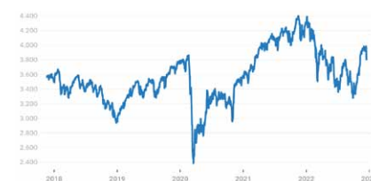
Euro Stoxx 50